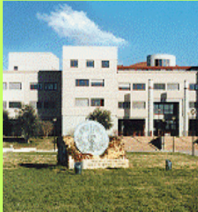
Università di Roma Tor Vergata Facoltà di Medicina e Chirurgia