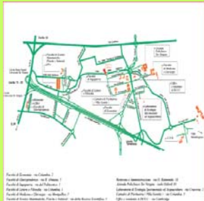
Università di Roma Tor Vergata Il Campus